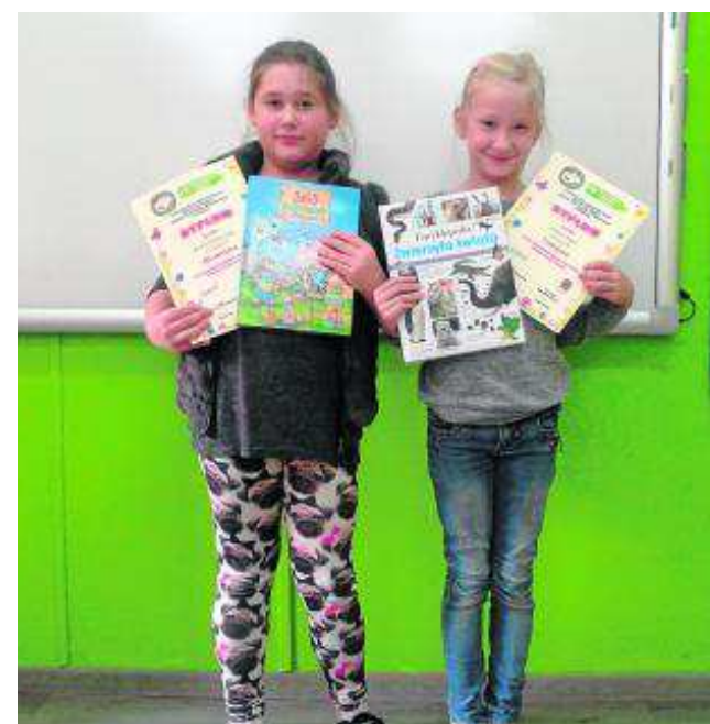
Uczennice z Mikołajowic świetnie się spisaly i zwyciężyły

Uczestnicy mogli w swoich pracach przedstawić piękno przyrody, które należy chronić, jak również ukazać negatywny wpływ człowieka na środowisko i sposoby jej ochrony. ●