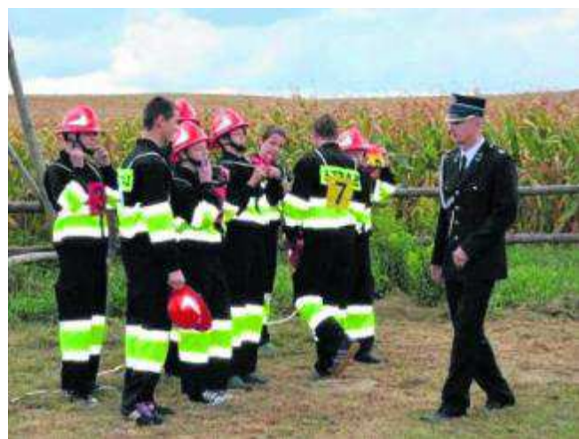
Pieniądze pójdą na sprzęt i szkolenie ochotników

Miedź. W ramach realizacji projektu odbędą się cztery szkolenia na temat prawidłowego zachowania się w przypadku wystąpienia nagłego zagrożenia środowiskowego. Szkolenia odbędą się jeszcze w tym roku w budynku nowej świetlicy wiejskiej w Raczkowej. ● (WF)